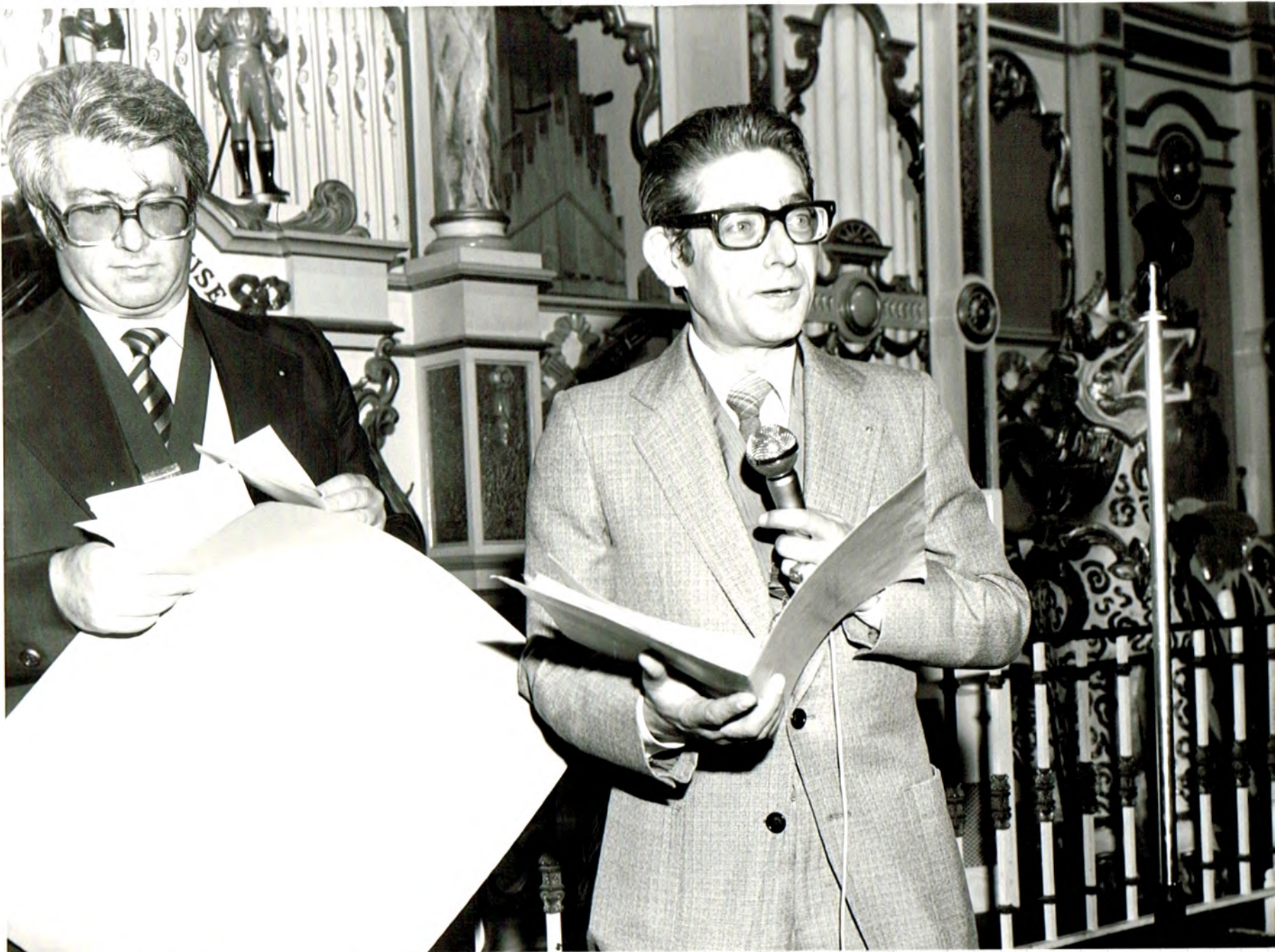
Michel BARGUES Présid. Rég. Rhône-Alpes

Le 15 Juin 1979, veille de l'Assemblée Nationale, remise de Charte au Club de LYON 2 au cours de la soirée chez Paul BOCUSE