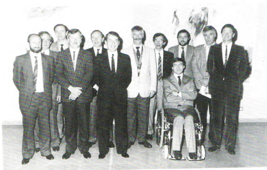
SARREGUEMINES PEUT ETRE FIER DE SES FILLEULS