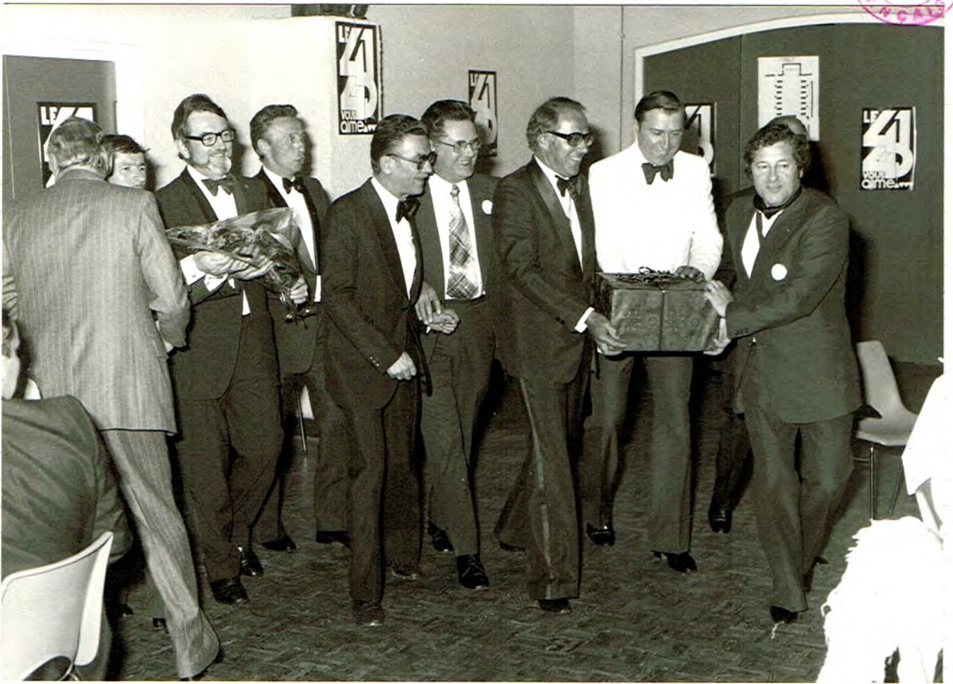
Remise de la cloche par NANTES 1 - Parrain