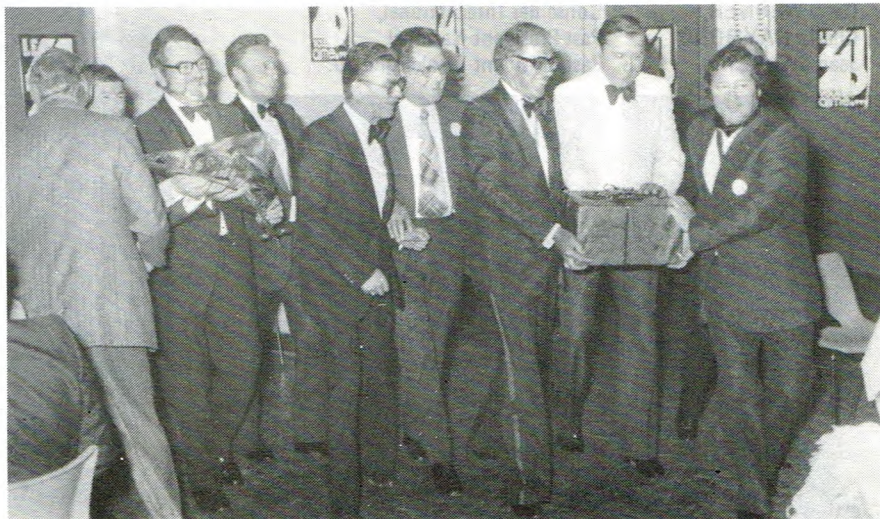
La table marraine de Nantes va offrir la cloche aux nouveaux 41

Au bar, un kir royal attendait les amis du nouveau club. A 21h30, tout le monde fut invité à se diriger vers la salle de restaurant. Les tables étaient agréablement décorées, de belles orchidées mauves rehaussées de freezias jaunes rendaient tout leur éclat sous la lumière chaude des chandelles. Sous le feu des spots lumineux, un «paquet