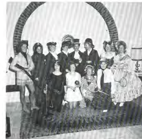
les 41 Arras en tenue de sport 1900