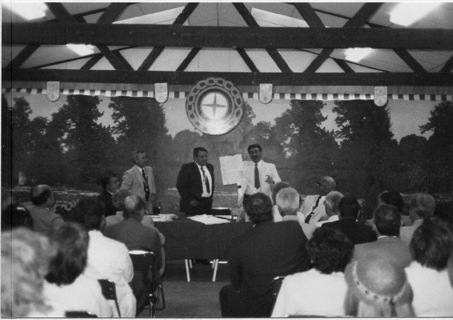
Remise de Charte AIX EN PROVENCE 2 n°108 Le 4 Juin 1983