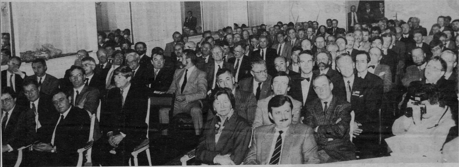
Baptême dans les salons de l'hôtel