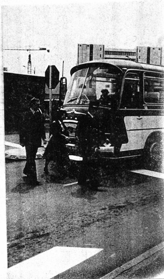
A la Douane