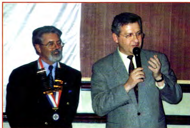
M. le Sénateur-Maire d'Haguenau