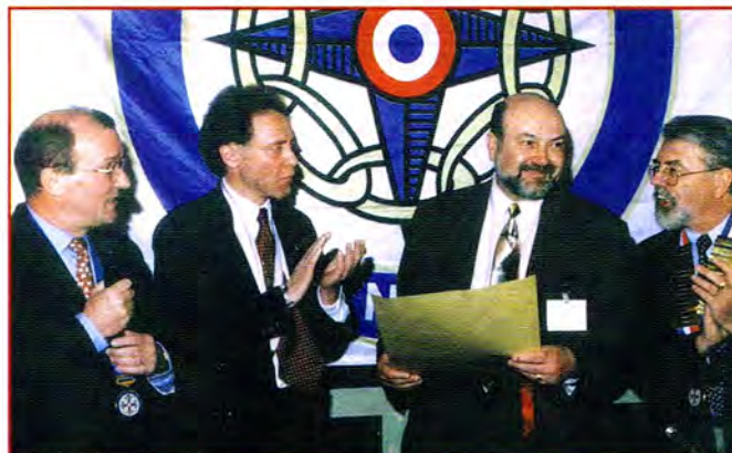
La Charte est signée